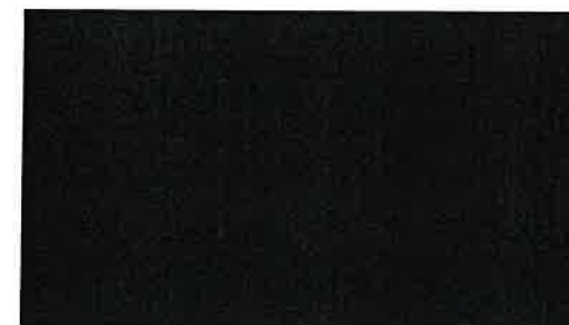
Etiqueta no trabalho