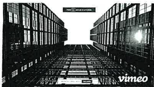
O que é a Corrupção?