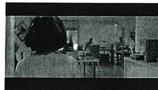
Assédio sexual no trabalho