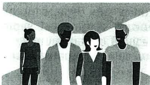
Assédio moral no trabalho

As ações de sensibilização apresentam-se nas seguintes temáticas: